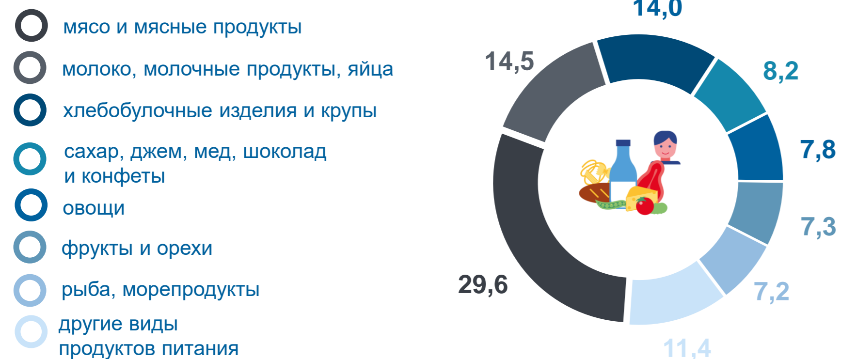
Структура расходов на питание, в % к итогу