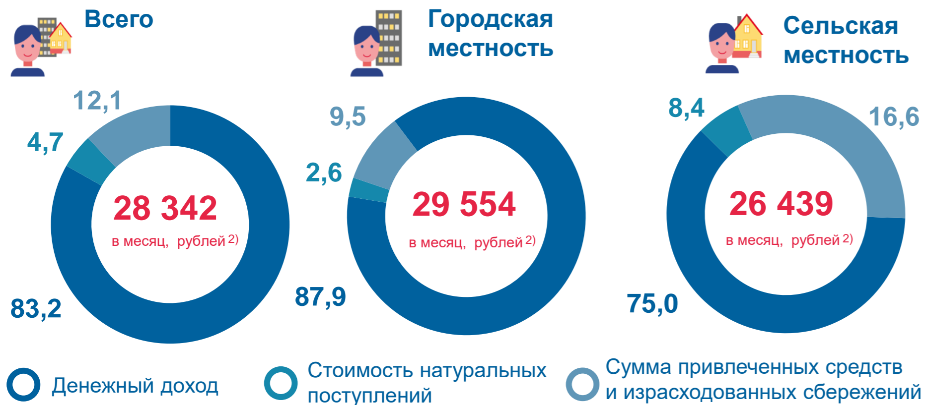
Структура располагаемых ресурсов домашних хозяйств, в % к итогу